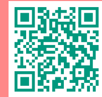
Itinéraire 5 km

Les deux itinéraires sont disponibles en version digitale sur l'application GéoVélo !