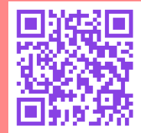
Itinéraire 10 km